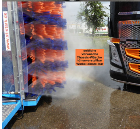
seitliche Vorwäsche Chassis-Wäsche höhenverstellbar Winkel einstellbar